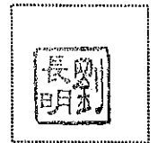
負責人印章 或代理人印章 或簽名